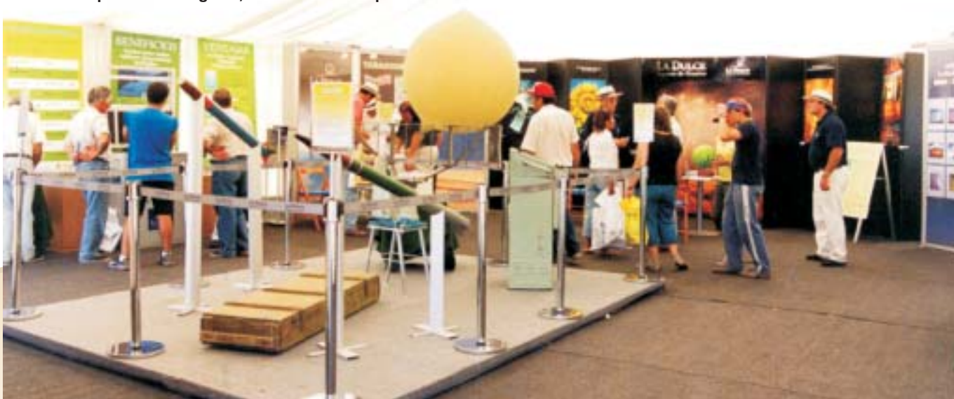
El museo del granizo exhibido en ExpoChacra despertó la curiosidad de los productores.