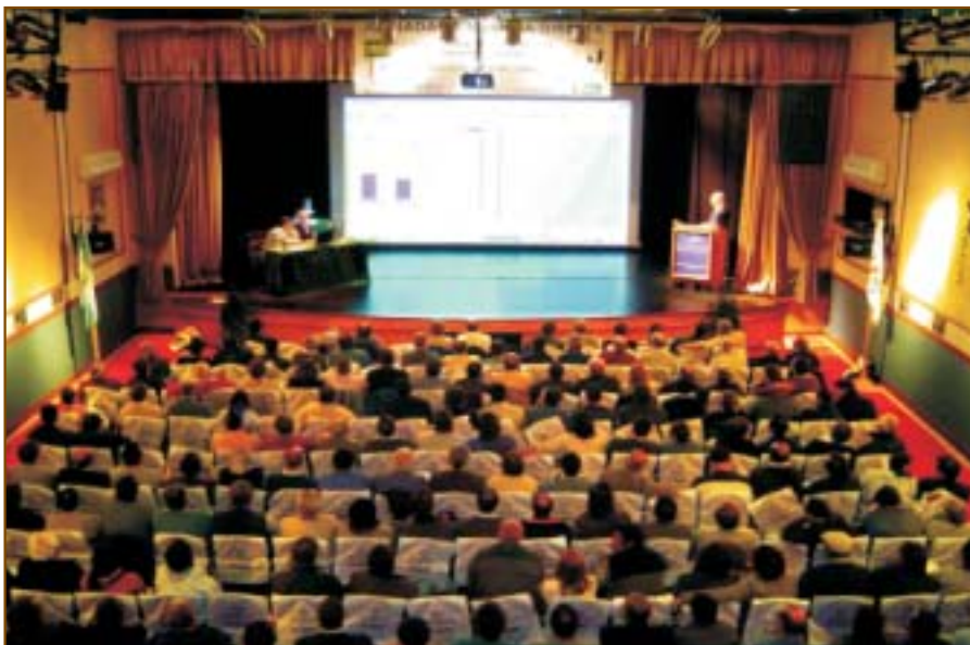
Centro de Convenciones de La Dulce.

Recordamos que para asistir a las charlas, los interesados deberán reservar su lugar con anticipación, dado que los cupos son limitados. Para informes y reservas, por favor dirigirse a: La Dulce Cooperativa de Seguros Ltda. Casa Central: Tel./ Fax: (02264) 432101 - Fax: 432046, e-mail: ladulce@ladulce.com.ar o al Centro de Atención al Asociado Pergamino: Tel./ Fax: (02477) 436239 / 428703, e-mail: pergamino@ladulce.com.ar ■