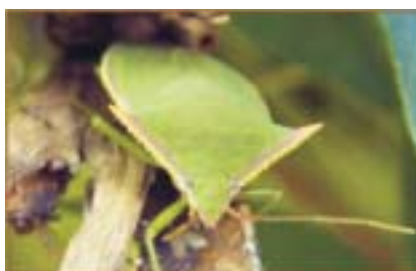
Piezodorus guildini (arriba) y Nezara viridula