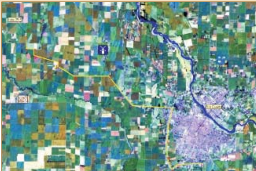
La imagen satelital permite identificar los lotes y los distintos cultivos. El trazo amarillo muestra el recorrido del flete desde el campo hasta el acopio

Ahondando un poco más en el tema del transporte, las imágenes satelitales permiten analizar la transitabilidad de los caminos, alertando sobre zonas anegadas o con dificultades para acceder a determinado lugar, evitando nuevamente demoras e incidentes ■