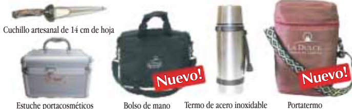
Cuchillo artesanal de 14 cm de hoja