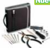
Set de herramientas