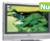
TV LCD 20"