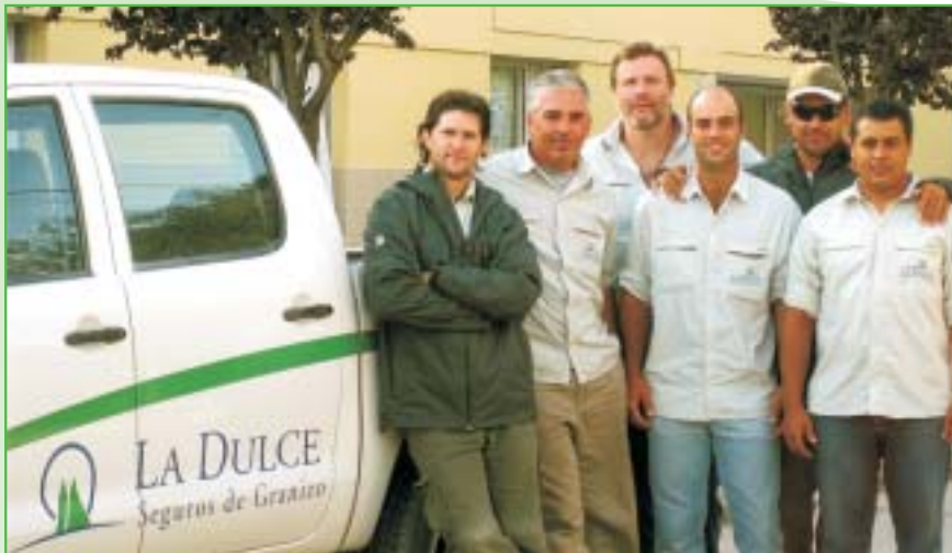
Grupo de tasadores de La Dulce Seguros a punto de iniciar la recorrida, en el sudeste bonaerense.

INTENSAS GRANIZADAS MANTUVIERON SUMAMENTE OCUPADO AL EQUIPO DE TASADORES DE LA DULCE SEGUROS, QUE DIAGRAMARON UNA MARATÓNICA RECORRIDA PARA RESPONDER A LAS PROFUSAS DENUNCIAS DE LOS ASOCIADOS. SE TASARON MÁS DE 20.000 HECTÁREAS DURANTE 30 DÍAS CONSECUTIVOS.