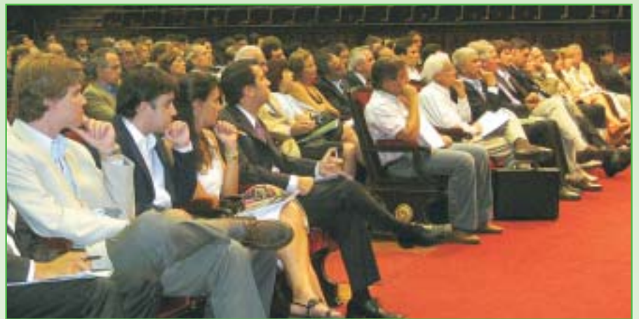
Vista del auditorio reunido en el Salón de Actos de la Facultad de Derecho de la UBA

EN EL MARCO DEL CONGRESO INTERNACIONAL SOBRE ESTRATEGIAS EMPRESARIAS, CELEBRADO EN LA UBA, LA DULCE SEGUROS TUVO UNA DESTACADA PARTICIPACIÓN, JUNTO AL NOBEL DE ECONOMÍA EDMUND PHELPS Y EL GRUPO DE EMPRESAS MÁS EXITOSAS DEL CONO SUR.