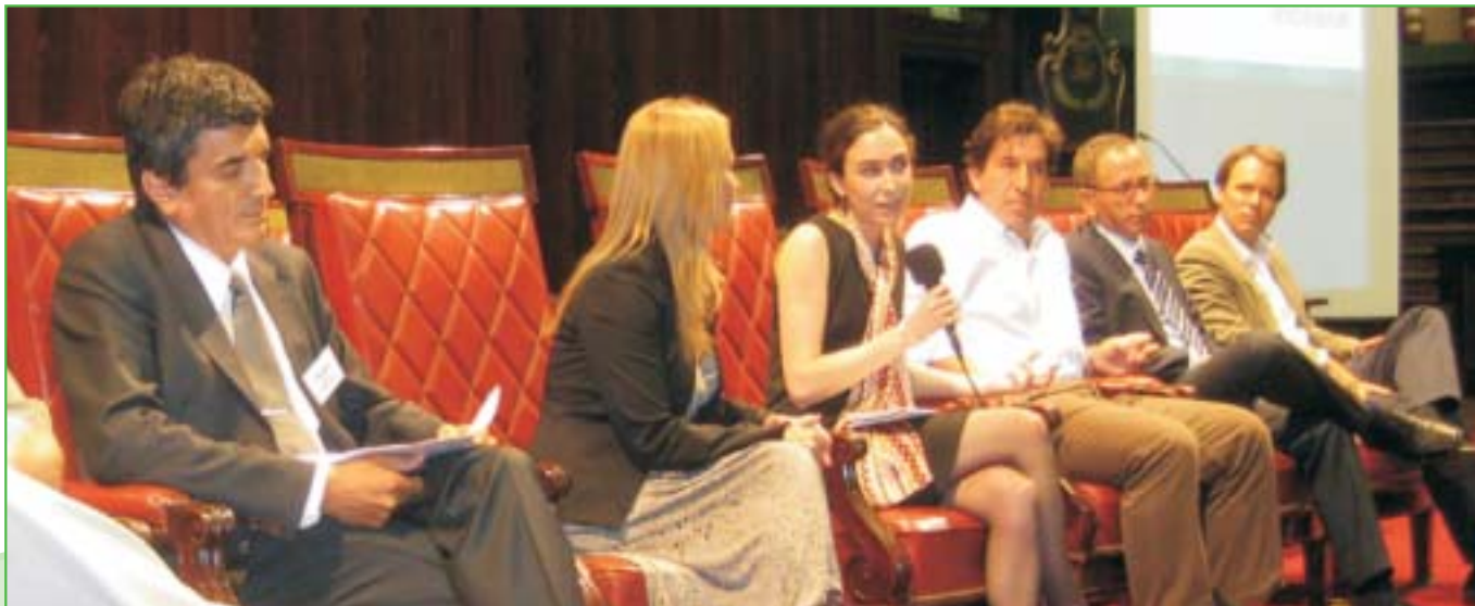
Panel de emprendedores destacados del Cono Sur.