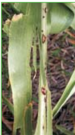
Daño por defoliación en maíz, provocado por el granizo

Hacia mediados de marzo, el grupo de tasadores se encontraba en el sudeste de la provincia de Buenos Aires, haciendo base en La Dulce, localidad sede de la cooperativa, y dispuestos a salir a hacer evaluaciones hacia la zona de Lumb, donde se precipitó una granizada con piedra chica, pero muy tupida. (Ver testimonial) ■