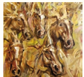
Salón principal de Fundación La Dulce e imágenes pictográficas expuestas.