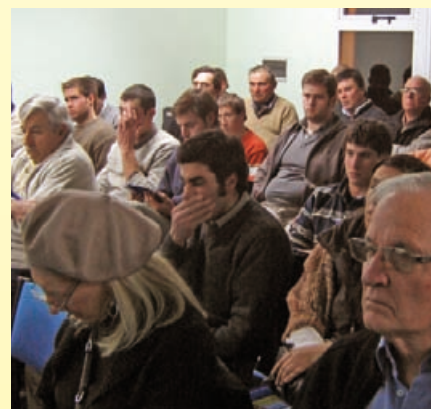
Público presente durante la charla en INTA Guaminí.

Al cierre del evento La Dulce Seguros ofreció una cena de camaradería. Los excedentes económicos derivados del evento fueron donados al Hospital Municipal de Guaminí. ☉