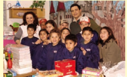
Alumnos de la Escuela N°34 de Campo Maipú.