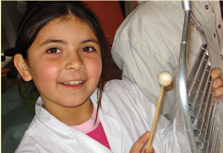
Alumna de la Escuela N° 6298 de J.B. Molina.