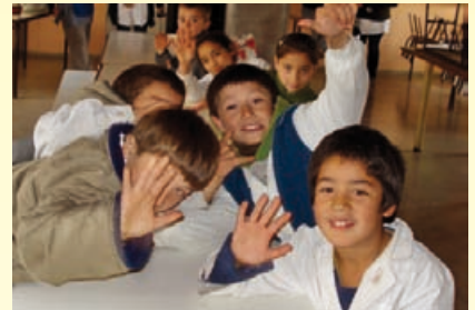
Escolares de Escuela Los Indios, de Rojas.

E n el marco del Programa Socio Solidario se concretaron cuatro proyectos apadrinados por los socios de La Dulce Cooperativa de Seguros. En esta oportunidad se complementó la acción de las escuelas rurales con la donación de pintura, libros, material didáctico, material recreativo y útiles escolares. Las accio-