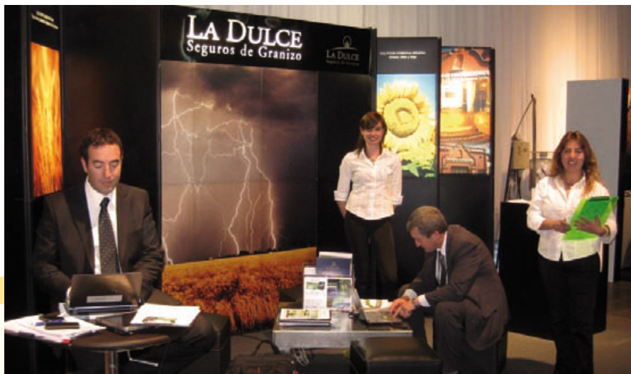
Stand de La Dulce Seguros en el Congreso de Aapresid 2010.

Luego agregó: “Estamos muy complacidos de estar aquí. Hemos recibido muchísimas consultas. Prácticamente no nos han dado respiro. También tuvimos oportunidad de brindar una charla para presentar un producto diseñado para los segmentos medio y alto, cuando hay dispersión de los lotes de siem-